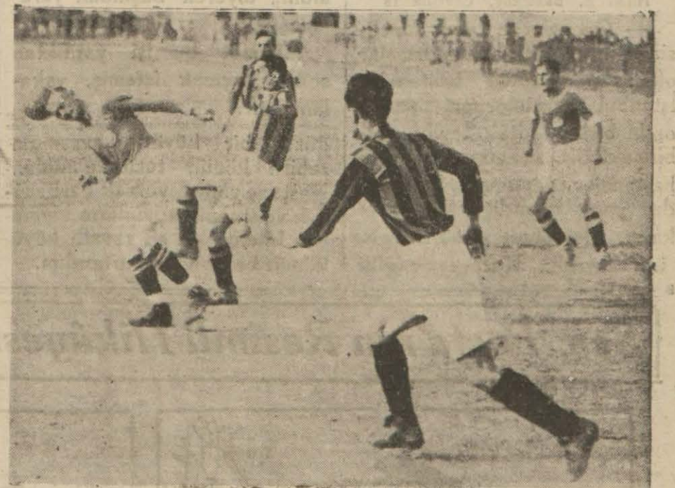
Dünkü maçtan heyecanlı bir dakika Dünkü maçın tafsilâtına girmeden evvel biraz hakemden bahsedelim: Almanlarla Fener maçının idaresi Zinger isminde bir Macara verilmişti. Fakat Zinger maçı o kadar fena idare etti ki oyuncular da, seyirciler de mütemadiyen sınırlendiler. Bu hal birinci serinin sonuna kadar devam etti. (Devamı 7 inci sayfamızda)

Dünkü Maçı Da Kazandık.. Fener, Almanları Üç Golle Yendi