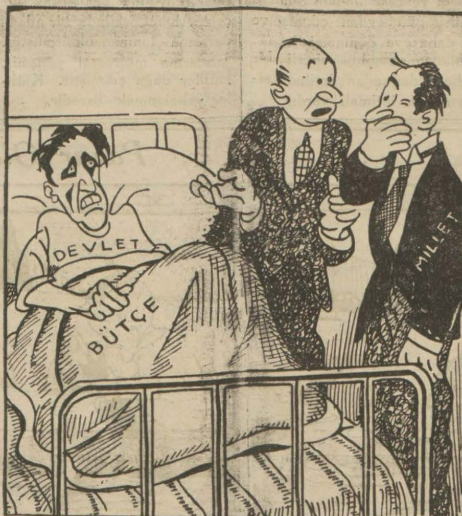
Hükümet — Ayağını yorgana göre uzat, ayaklarını biraz kısıl. Millet — Ayaklarını kısacağı kadar kısımış, biraz da başını ve omuzlarını yorganın içine çeksin.