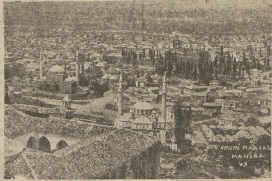
Hapisanesindeki bütün mahkûmları kaçan Manisa.. (18) i de (7) ve (8) senelik mahkûmlardır. Mütebaki on kişi adı mevkuflardan ibarettir.

Kaçanların adedi 31 kişidir. Bunlardan (3) ü (15) senelik,